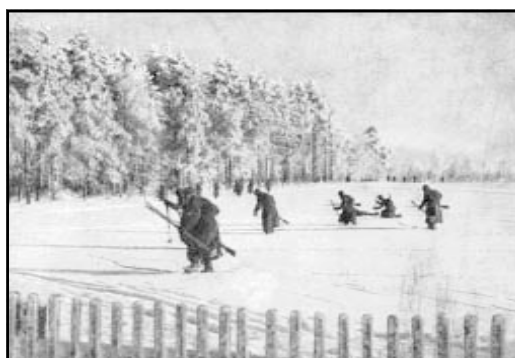
Пехота в наступлении.