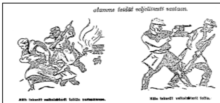
Советская агитация и пропаганда, распространявшаяся в в тылу противника в виде разбрасываемых с самолетов листовок.

Чили, Боливия Перу и Парагвай выразили протест в связи с советской агрессией.