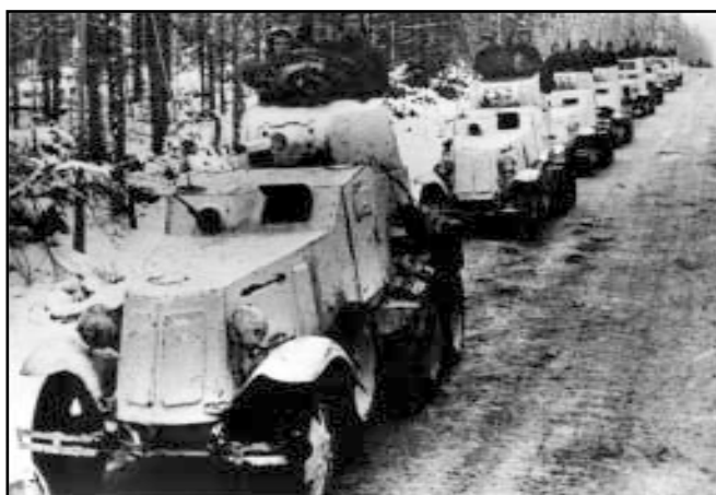
Бронеколонна на марше.