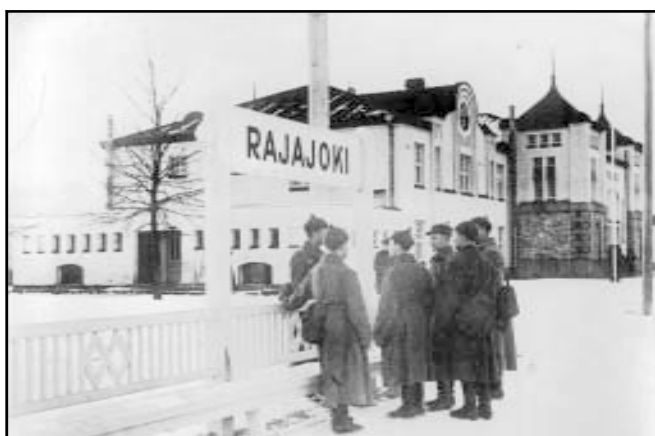
Красноармейцы на захваченной станции Раяйоки.

Расстояние от пограничной финской железнодорожной станции Раяйоки до Териоки передовые части Красной Армии преодолели за сутки. События этих суток запечатлены на фотографиях.