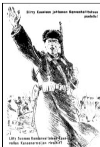
Вступай в Народную Армию! Советский пропагандистский рисунок.