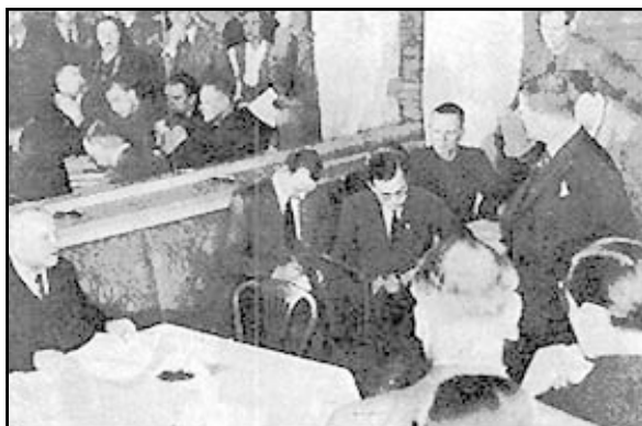
Лига Наций проводит заседание по финляндскому вопросу.