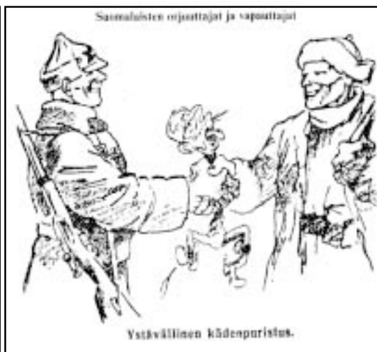
Дружеское рукопожатие. Финские поработители и освободители. Советский пропагандистский рисунок.