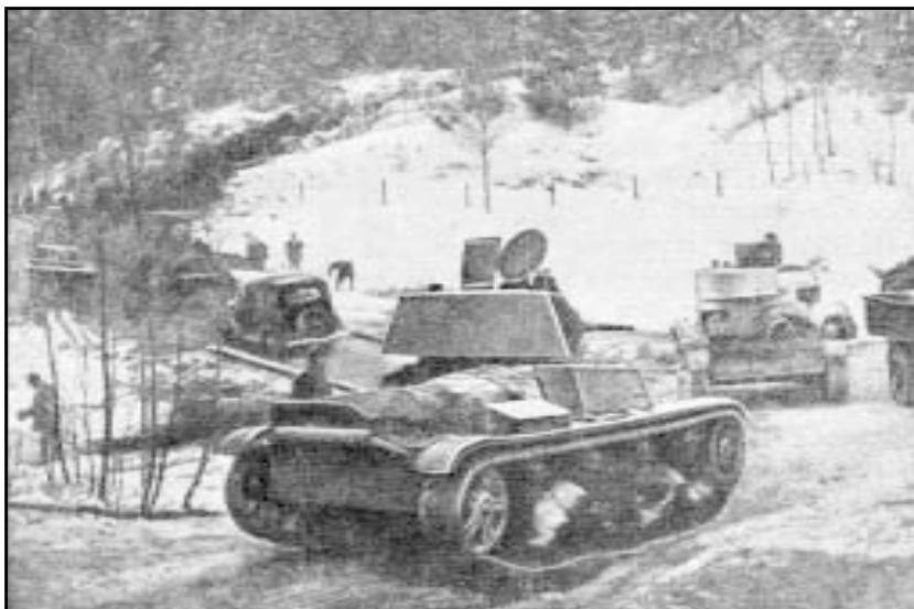
Механик-водитель получает боевую задачу. Танки переходят границу. Фотохроника ТАСС. Фотохроника ТАСС.

Расстояние от пограничной финской железнодорожной станции Раяйоки до Териоки передовые части Красной Армии преодолели за сутки. События этих суток запечатлены на фотографиях.