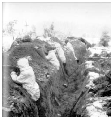
На фото: танковая атака финских позиций (слева), финны заняли обороны в передовых траншеях укрепузла Суммакюля.