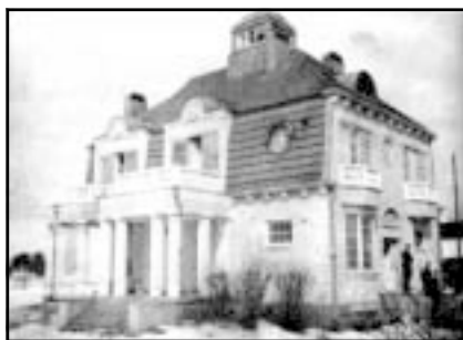
Здание бывшей дачи Новикова, где до захвата Териоки размешалось офицерское собрание 1-го егерского батальона, было представлено под резиденцию О.В. Куусинена.

Жена Отто Куусинена Айно была репрессирована и в период 1938-1955 гг. отбывала срок в тюрьмах и лагерях. Дочь О. Куусинена от первого брака Хертта являлась после второй мировой войны одним из руководителей Коммунистической партии Финляндии.