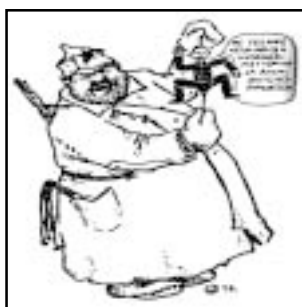
Мы заключаем договор о ненападении и взаимопомощи. Карикатура из журнала «Гаккапелит»