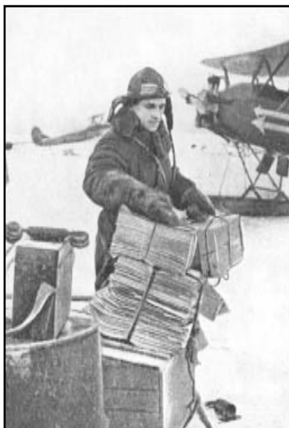
Советский авиатор готовится к вылету на распространение агитлисток .

Немецкие газеты обвиняют Англию и министра иностранных дел Швеции Сандлера за подстрекательство Финляндии к войне против Советского Союза.