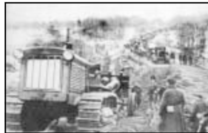
Тяжелая артиллерия переходит на новые огневые позиции в районе деревни Я[ппиля]

Наша авиация совершала плановые разведывательные и дозорные вылеты. Наши ВВС и ПВО сбили либо заставили приземлиться всего 24 вражеских самолета. При этом потери нашей авиации составили 2 самолета.