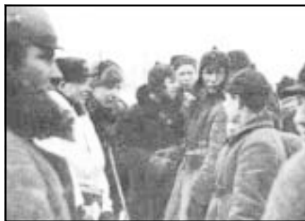
Война, в которой не оказалось ни победителей, ни побежденных, завершилась неформальным общением солдат.