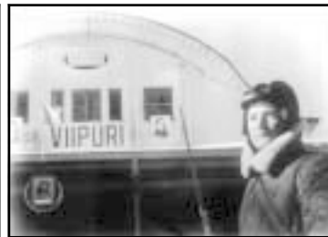
14 марта 1940 г., после отвода финских войск из центра города Выборг стал советским.