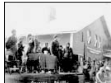
Митинг на привокзальной площади г. Выборга по случаю победы над финской белоохранительщиной. Участники митинга — личный состав 35-й ПТБр.