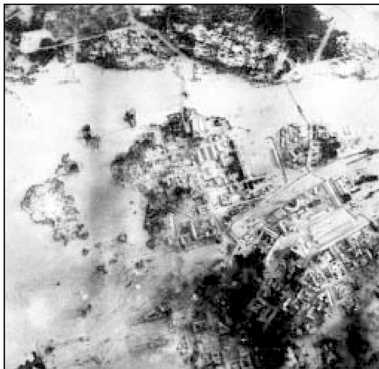
Бомбардировка Выборга с воздуха.