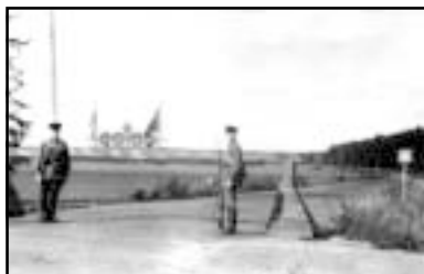
Советские пограничники на охране новой границы.