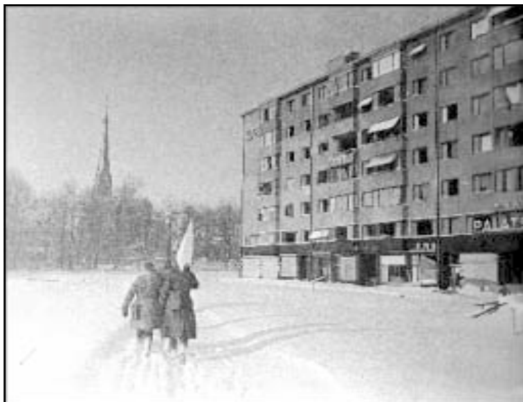
14 марта 1940 г. в центре Выборга на площади Красного колодца состоялась встреча советских и финских парламентариев. Стороны договорились о порядке отвода финских войск за новую демаркационную линию. На фото: советская делегация следует к месту переговоров.