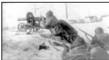
Бой в предместьях Выборга.