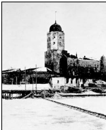
Выборгский замок со следами пожара в последний день войны.