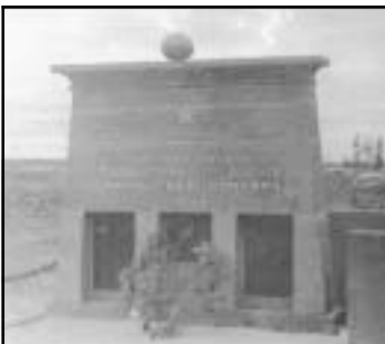
Братская могила на высоте 65,5.