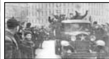
Поскольку из планов проведения совместного парада Красной армии и Народной Армии Финляндии по улицам Хельсинки ничего не вышло, то в марте 1940 года пришлось ограничиться парадом Победы в Ленинграде.