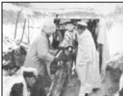
Финские артиллеристы на позициях в Монрепо.

...Между тем бои за Выборг на южных подступах к городу продолжались прежней неослабевающей силой. Медленно, но безостановочно продвигались вперед от одного участка к другому пехота, саперы, артиллеристы, танки.