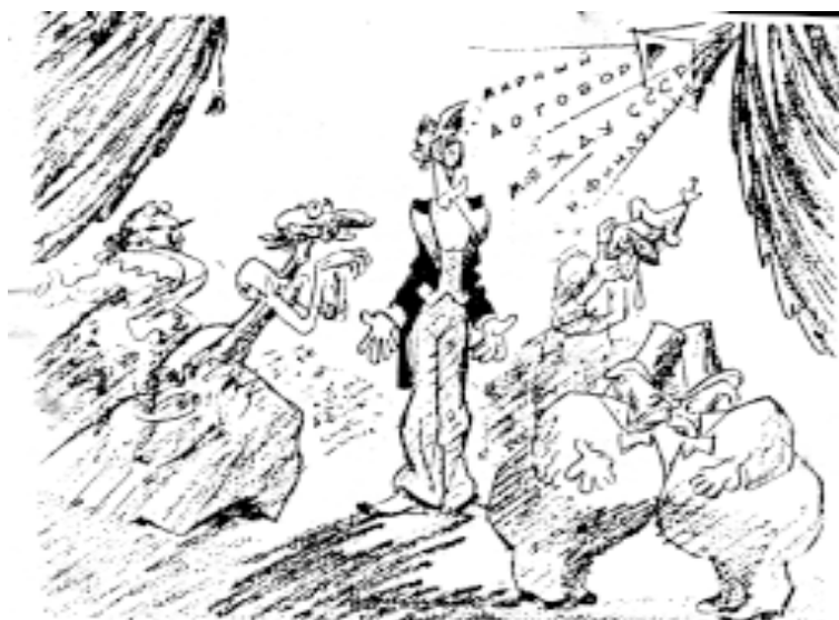
Немая сцена в Лондоне

В течение 7—12 марта в Москве происходили переговоры между уполномоченным СССР — Председателем Совета Народных Комиссаров СССР и Народным Комиссаром Иностранных Дел В.М. Молотовым, членом Президиума Верховного Совета СССР А.А. Ждановым и комбригом А.М. Василевским — с одной стороны, и уполномоченными Финляндской Республики — Председателем Совета Министров Финляндии г-ном Р. Рюти, Министром Ю.К. Паасикиви, генералом К.Р. Вальден и профессором В. Войонмаа — с другой, по вопросу о прекращении военных действий и заключении мирного договора между СССР и Финляндией. Переговоры закончились подписанием 12 марта 1940 г. Мирного Договора между Советским Союзом и Финляндией. Тексты Мирного Договора и Протокола к нему приводятся ниже.