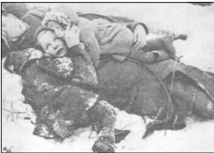
Жители сельской местности не имели никакой другой защиты от воздушных налетов кроме леса.