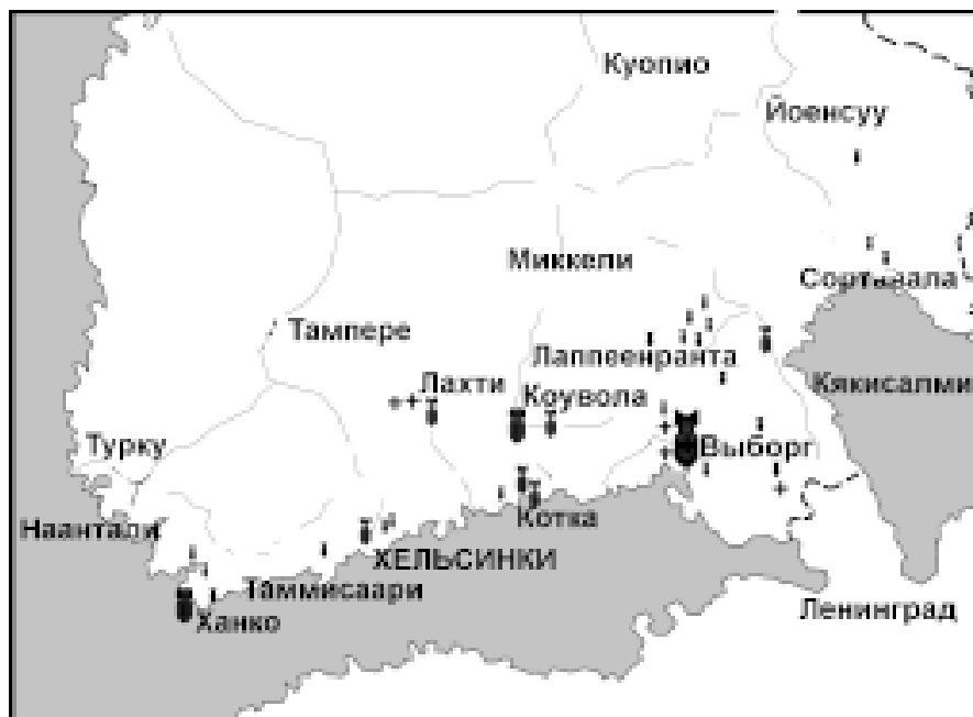
Населенные пункты Южной Финляндии, подвергшиеся бомбовым ударам советской авиации в первую неделю войны.

С ПЕРВЫХ ДНЕЙ ВОЙНЫ СОВЕТСКАЯ АВИАЦИЯ РЕГУЛЯРНО СОВЕРШАЛА НАЛЕТЫ С ЦЕЛЮ НАНЕСЕНИЯ БОМБОВЫХ УДАРОВ ПО «ВОЕННЫМ ОБЪЕКТАМ» ФИНЛЯНДИИ. ОДНАКО ВВИДУ НЕТОЧНОСТИ НАНЕСЕНИЯ ПОДОБНЫХ УДАРОВ, ЛИБО ВВИДУ ИНЫХ ПРИЧИН ЖЕРТВАМИ ЭТИХ БОМБАРДИРОВОК СТАНОВИЛИСЬ ГРАЖДАНСКИЕ ЛИЦА, В РЕЗУЛЬТАТЕ СОВЕТСКИХ БОМБАРДИРОВОК В ФИНЛЯНДИИ ПОГИБЛО 848 ЧЕЛОВЕК ИЗ ЧИСЛА МИРНЫХ ЖИТЕЛЕЙ. ОБЩЕЕ КОЛИЧЕСТВО ЖЕРТВ СОВЕТСКИХ АВИАНАЛЕТОВ К КОНЦУ ВОЙНЫ В ФИНЛЯНДИИ СОСТАВИЛО 956 УБИТЫХ, 540 ТЯЖЕЛО РАНЕНЫХ И 1300 ЛЕГКО РАНЕНЫХ.