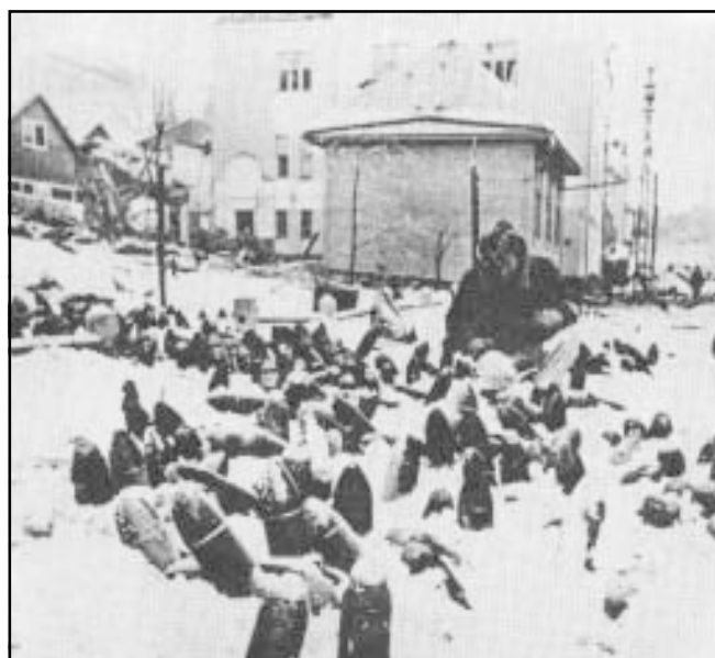
Неразорвавшиеся авиабомбы на улице города.

Среди городского населения жертвами бомбардировок советской авиации стали жители: Хельсинки — 97 чел., Выборга — 60 чел., Миккели — 53 чел., Турку — 52 чел., Янисярви — 49 чел., Исалми — 41 чел., Куопио — 38 чел., Лаппеенранта — 37 чел., Элисенваара — 35 чел., Сортавала — 31 чел., Коувела — 28 чел., Рованиеми — 25, Лаhti — 23 чел., Вааса — 22 чел., Пори — 21 чел., Тампере — 18 чел., Хямеенлинна — 13 чел., Каякисалми — 12 чел., Антреа — 11 чел., Сейняйоки — 10 человек