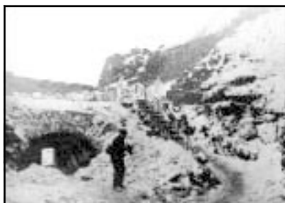
Уурас (ныне Высоцк) захваченный Красной Армией в феврале 1940 г. Зоринские укрепления XIX века.

В «Комсомольской правде» опубликована статья О.В. Куусинена, в которой он призывает Хельсинкское правительство согласиться на мирные предложения СССР ради прекращения напрасного кровопролития.