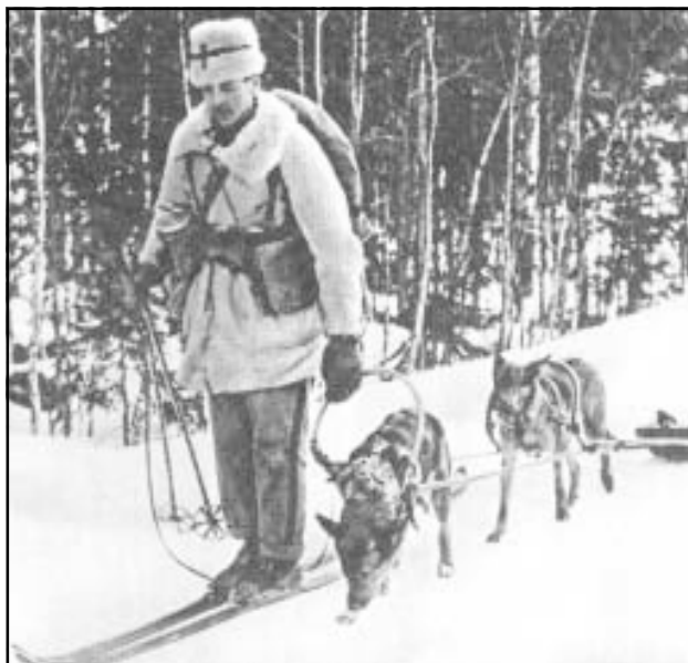
Шведские добровольцы на севере Финляндии.

Наша авиация вела активные действия по войскам и военным объектам противника. Авиация противника не появлялась в воздухе.