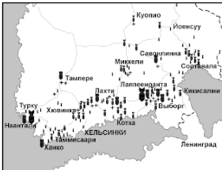
Населенные пункты Южной Финляндии, подвергшиеся бомбовым ударам советской авиации в последнюю неделю войны.

Наша авиация вела активные действия по войскам и военным объектам противника, при этом сбито 8 самолетов противника.