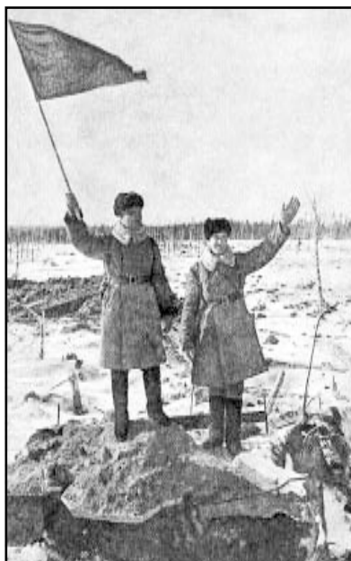
Над ДОТом взвилось красное знамя....

Ал. Молчанов. Прорыв. Штурм линии Маннергейма. 1940.