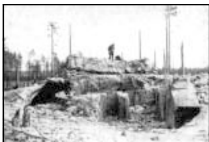
Один из разрушенных ДОТов.

Нижняя палата английского парламента рассматривает вопрос об отправке добровольцев в Финляндию. Английское правительство одобряет выдачу основанным в Лондоне финским вербовочным пунктам разрешений на деятельность.