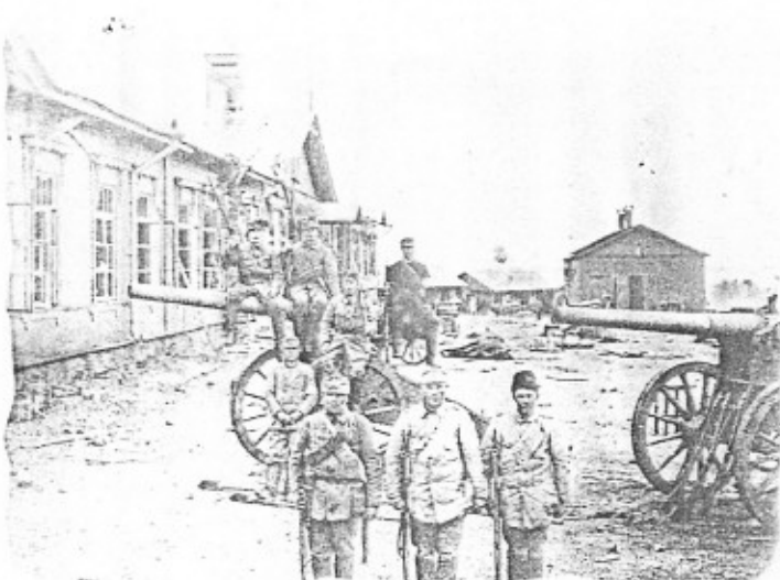
Выборг, 1918 год.