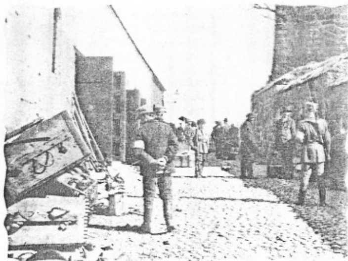
Выборг, 1918 год. Фотография из Музейного ведомства Финляндии.