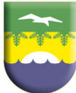
ГРАФИК ПРИЕМА ГРАЖДАН В ЯНВАРЕ 2021 ГОДА