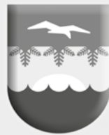
ГРАФИК ПРИЕМА ГРАЖДАН В НОЯБРЕ 2019 ГОДА