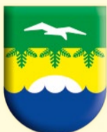
ГРАФИК ПРИЕМА ГРАЖДАН В АВГУСТЕ 2019 ГОДА

Глава муниципального образования – председатель Муниципального Совета города Зеленогорска