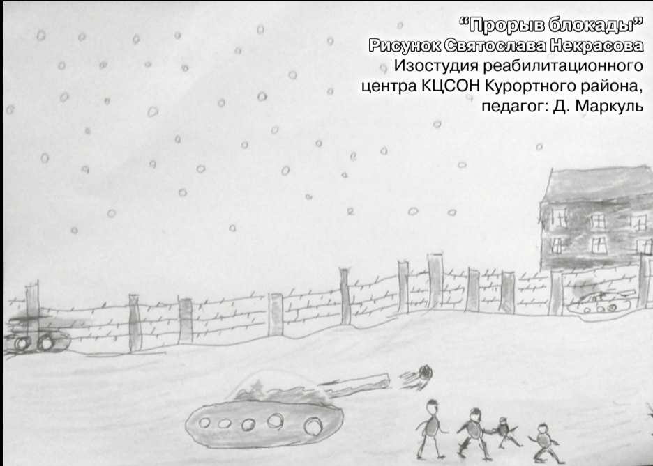
Рисунок Святослава Некрасова Изостудия реабилитационного центра КЦСОН Курортного района, педагог: Д. Маркуль