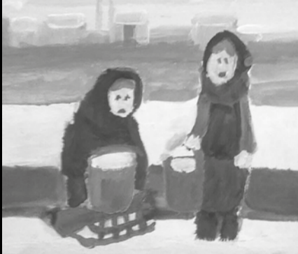
Рисунок Анны Петровой (Изостудия реабилитационного центра КЦСОН Курортного района, педагог: Д. Маркуль)