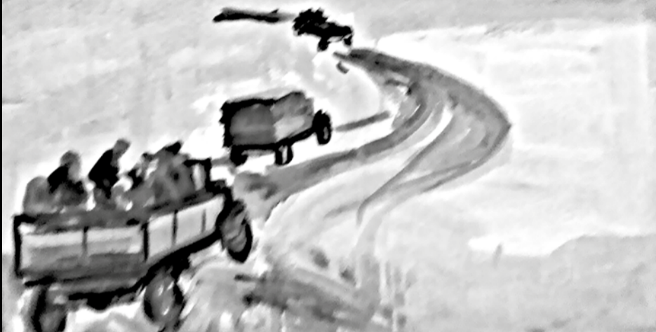
Рисунок Сергея Рычкова. Изостудия реабилитационного центра КЦСОН Курортного района, педагог: Д. Маркуль.