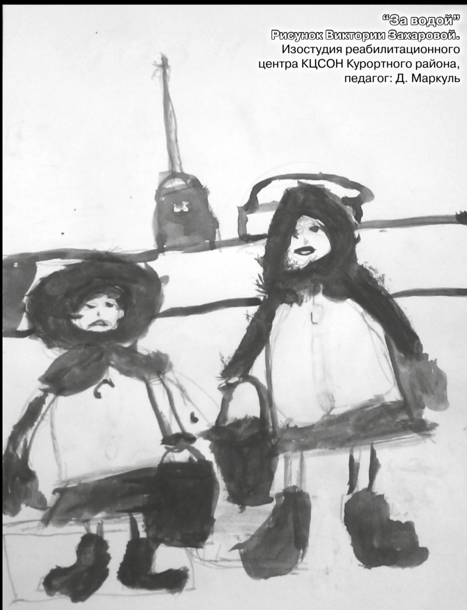
Рисунок Виктории Захаровой. Изостудия реабилитационного центра КЦСОН Курортного района, педагог: Д. Маркуль