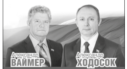
ГРАФИК ПРИЕМА ГРАЖДАН В ФЕВРАЛЕ 2017 ГОДА