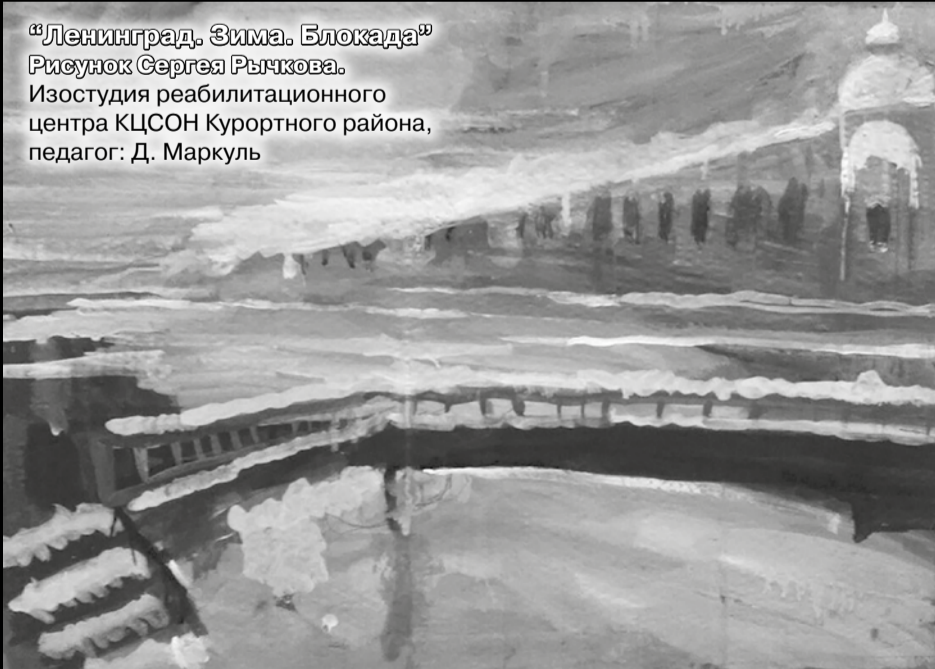
Рисунок Сергея Рычкова. Изостудия реабилитационного центра КЦСОН Курортного района, педагог: Д. Маркуль