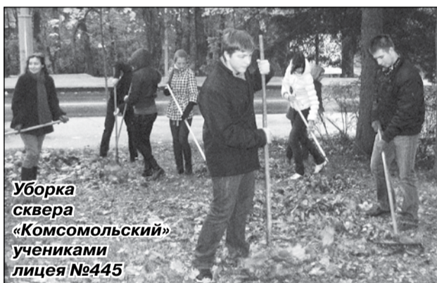
Уборка сквера «Комсомольский» учениками лицея №445

Лицей №445 так же не остается равнодушным к экологическим проблемам. Весной и осенью школьники принимают участие в акции «Чистый город», в течение учебного года участвуют в различных конкурсах экологической направленности: «ЭКОвидение», «Край родной» и др. А летом на базе лицея работает городской детский оздоровительный лагерь. Ребята ведут здоровый образ жизни: по утрам делают зарядку, посещают кружки и секции в доме детского творчества, играют в подвижные игры на свежем воздухе. Для воспитанников лагеря проводятся экологические праздники. Например, Лесной фестиваль, о котором мы и расскажем в этом номере.