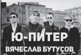
Ю-ПИТЕР ВЯЧЕСЛАВ БУТУСОВ