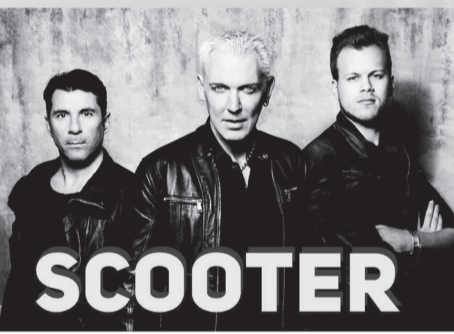
SCOOTER 6 СЕНТЯБРЯ