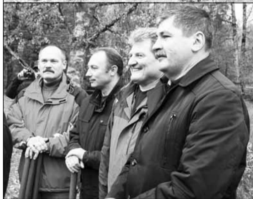
В Зеленогорске в рамках Всероссийской акции «Живи Лес!», в районе «Тропы природы» (пр. Ленина д. 72.) было высажено более 130 деревьев: шаровидные ивы, дубы, каштаны.